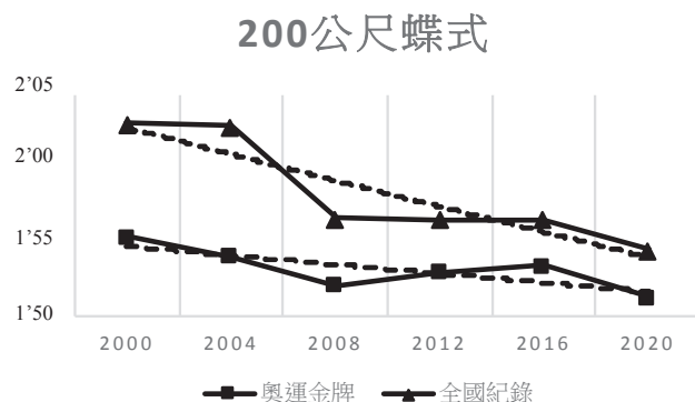
圖 1 200 公尺蝶式奧運金牌選手與我國全國紀錄之成績比較